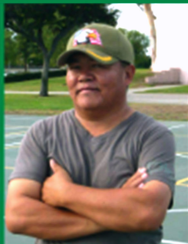
ཚུམ་གླིང་གི་དགའ་ལྗོངས་ལྷོ་མོ་བཟང་ལུང་གྲུབ།

Kalsang Gyaltsen Lhopa Khangtsen Gashar Monastery P.O. Tibetan Colony-581411 Mundgod (N.K) (K.S) INDIA Phone: 0091-8722558848 e-mail: drikalsang@gmail.com